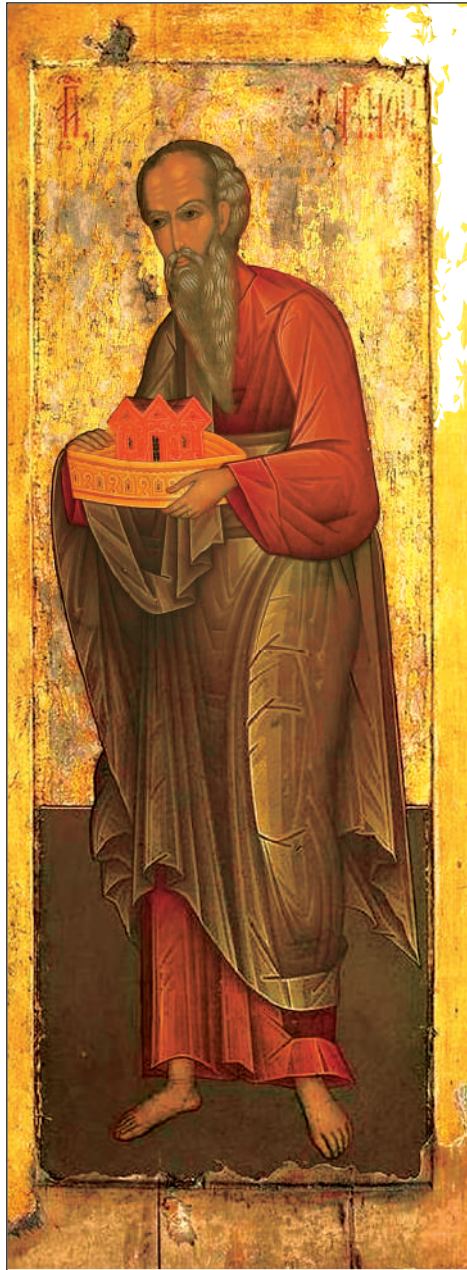
Сл. 6. Свети пророк Мојсеј

А кад се људи почеше множити на земљи, и кћери им се народише. Видећи синови Божји кћери човјечије како су лијепе узимаше их за жене које хтјеше. А Господ рече: неће се дух мој до вијека прети с људима, јер су тијело; нека им још сто и двадесет година. А бијаше тада дивова на земљи; а и послѣје, кад се синови Божји састајаху са кћерима човјечјим, па им оне рађаху синове; то бијаху силни људи, од старине на гласу. И Господ видјећи да је неваљалство људско велико на земљи, и да су све мисли срца њихова свагда само зле, Покаја се Господ што је створио човјека на земљи, и би му жао у срцу. И рече Господ: хоћу да истријем са земље људе, које сам створио, од човјека до стоке и до ситне животиње и до птица небеских; јер се кајем што сам их створио. Али Ноје нађе милост пред Господом. Ово су догађаји Нојеви: Ноје бјеше човјек праведан и безазлен својега вијека; по вољи Божјој свагда живљаше Ноје. И роди Ноје три сина: Сима, Хама и Јафета. А земља се поквари пред Богом, и напуни се земља безакоња. И погледа Бог на земљу, а она бјеше покварена; јер свако тијело по-