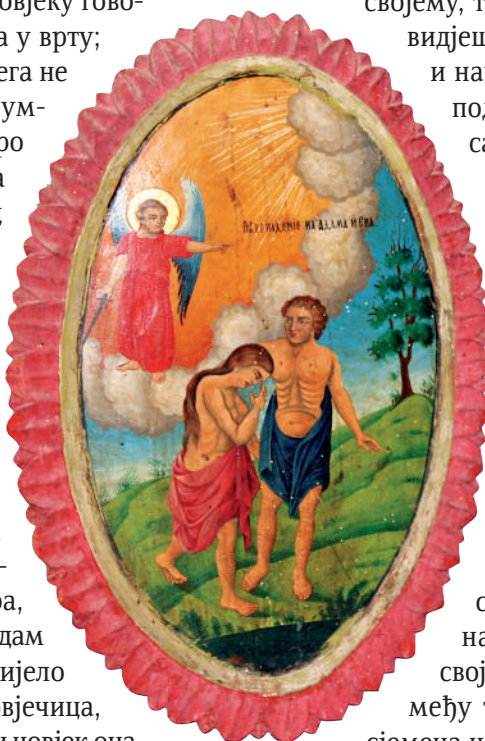
Сл. 3. Проћнање из Раја