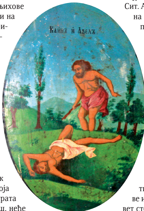
Сл. 5. Каин и Авељ

Иза тога Адам позна Јеву жену своју, а она затрудње и роди Кајина, и рече: добих човјека од Господа. И роди опет брата његова Авеља. И Авељ поста пастир а Кајин ратар. А послѣ некога времена догоди се, те Кајин принесе Господу принос од рода земаљскога; а и Авељ принесе од првина стада својега и од њихове претилине. И Господ погледа на Авеља и на његов принос, а на Кајина и на његов принос не погледа. Зато се Кајин расрди веома, и лице му се промијени. Тада рече Господ Кајину: што се срдиш? што ли ти се лице промијени? Нећеш ли бити мио, кад добро чиниш? А кад не чиниш добро, гријех је на вратима. А воља је његова под твојом влашћу, и ти си му старији. Послѣ говораше Кајин с Авељем братом својим. Али кад бијаху у пољу, скочи Кајин на Авеља брата својега, и уби га. Тада рече Господ Кајину: гдје ти је брат Авељ? А он одговори: не знам; зар сам ја чувар брата својега? А Бог рече: шта учини! глас крви брата твојега виче са земље к мени. И сада, да си проклет на земљи, која је отворила уста своја да прими крв брата твојега из руке твоје. Кад земљу узрадиш, неће ти више давати блага својега. Бићеш потукач и бјегунац на земљи. А Кајин рече Господу: кривица је моја велика да ми се не може опростити. Ево ме тјераш данас из ове земље да се кријем испред тебе, и да се скитам и потуцам по земљи, па ће ме убити ко ме удеси. А Господ му рече: