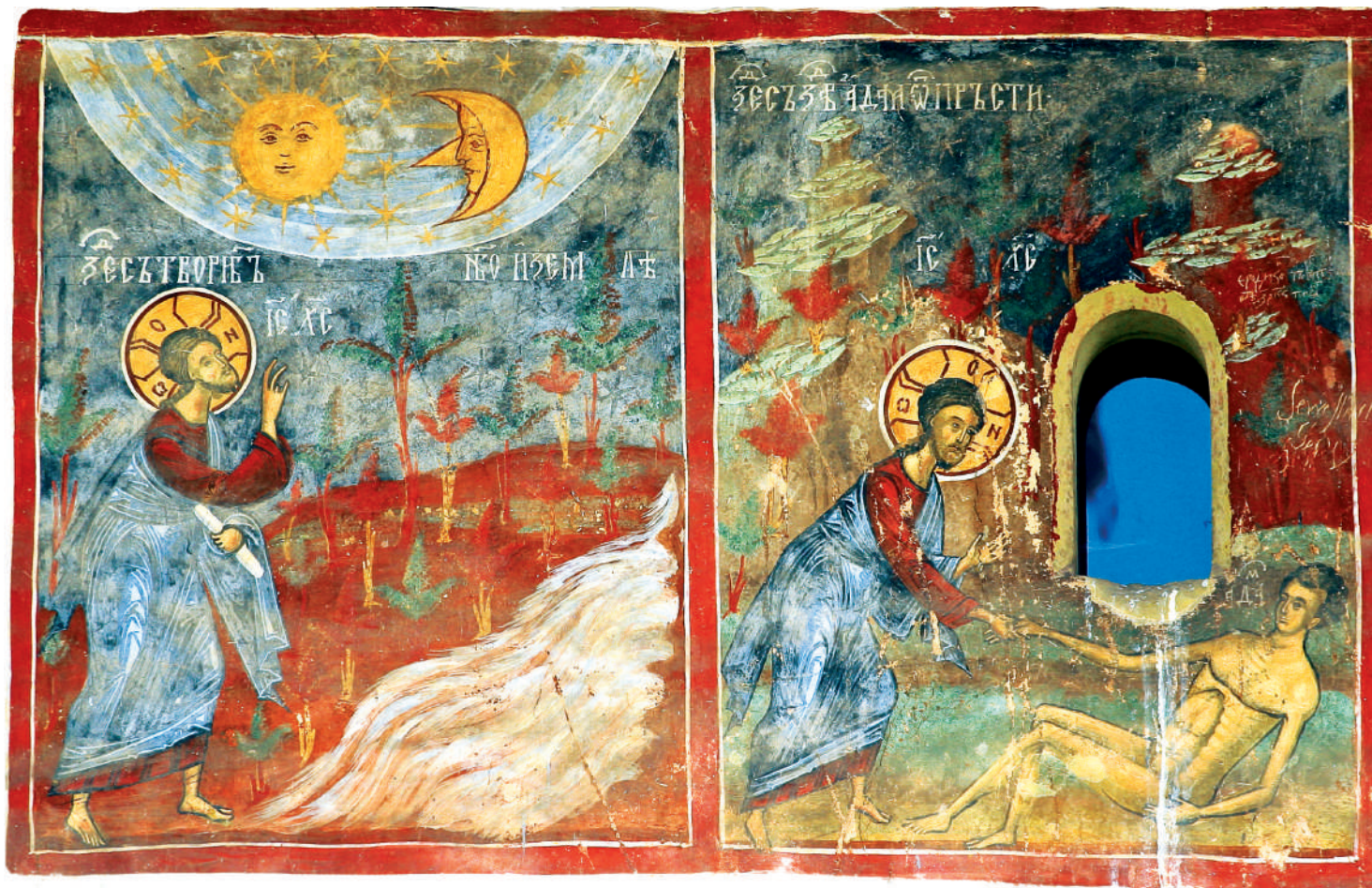
Сл. 1. Стварање свећа и човека кроз Сина и Лотоса Божијег