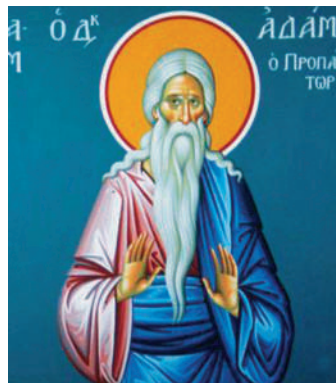
Сл. 4. Свѣтѣи пророци Адам

и он ће ти бити господар. Па онда рече Адаму: што си послушао жену и окусио с дрвета с којег сам ти забранио рекавши да не једеш с њега, земља да је проклета с тебе, с муком ћеш се од ње хранити до својега вијека; трње и коров ће ти рађати, а ти ћеш јести зеље пољско; са знојем лица својега јешћеш хлеб, докле се не вратиш у земљу од које си узет; јер си прах, и у прах ћеш се вратити. И Адам надједје жени својој име Јева, зато што је она мати свјема живима. И начини Господ Бог Адаму и жени његовој хаљине од коже, и обуче их у њих. И рече Господ Бог: ето, човјек поста као један од нас знајући што је добро што ли зло; али сада да не пружи руке своје и узбере и с дрвета од живота, и окуси, те до вијека живи. И Господ Бог изагна га из врта Едемскога да ради земљу, од које би узет; и изагнав човјека постави пред вртом Едемским херувима с пламенијем мачем, који се вијаше и тамо и амо, да чува пут ка дрвету од живота.